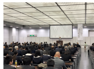
2018/4/9 青少年フォーラム井村雅代氏

お問い合わせ ☎ロータリーフェローズ2650 事務局 rotaryfellows@rid2650.gr.jp facebook ページ「ロータリーフェローズ2650」 fb.me/RotaryFellows2650 地区ホームページ http://rid2650-pub.com/dc034/