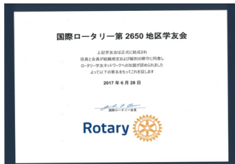
6/28に日本で2番目にRI 認証済