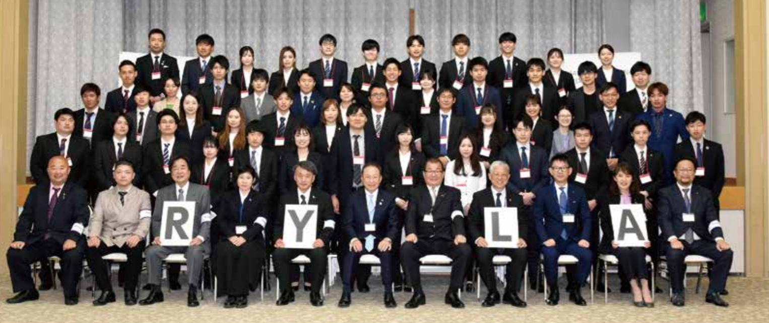
国際ロータリー第2650地区 2022-23年度 RYLA受講生