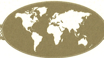
President, Rotary International

A handwritten signature in black ink, appearing to read "Jan A. P. P. P.", written over a horizontal line.